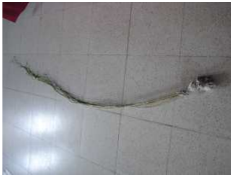
Borrassà, 20 de març de 2012